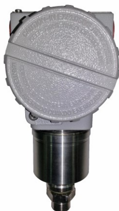
Рисунок 3 – Общий вид датчиков давления тензорезистивных AMZ