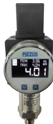
Рисунок 4 – Общий вид датчиков давления тензорезистивных ASZ