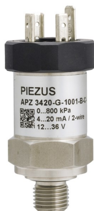
Рисунок 1 – Общий вид датчиков давления тензорезистивных APZ

- ALZ 3920 – малогабаритный датчик избыточного давления в корпусе из нержавеющей стали для давлений от 4 кПа до 1 МПа (~0,4 м вод.ст. до 100 м вод.ст.).