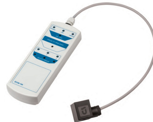
Рисунок А.1 – Внешний вид конфигуратора